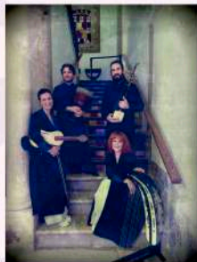
Todos los Tonos y Ayres

Un recorrido a través de la Ruta de la Seda, desde la Europa medieval hasta la vibrante escena multicultural de la China Imperial de las dinastías Song y Yuan.